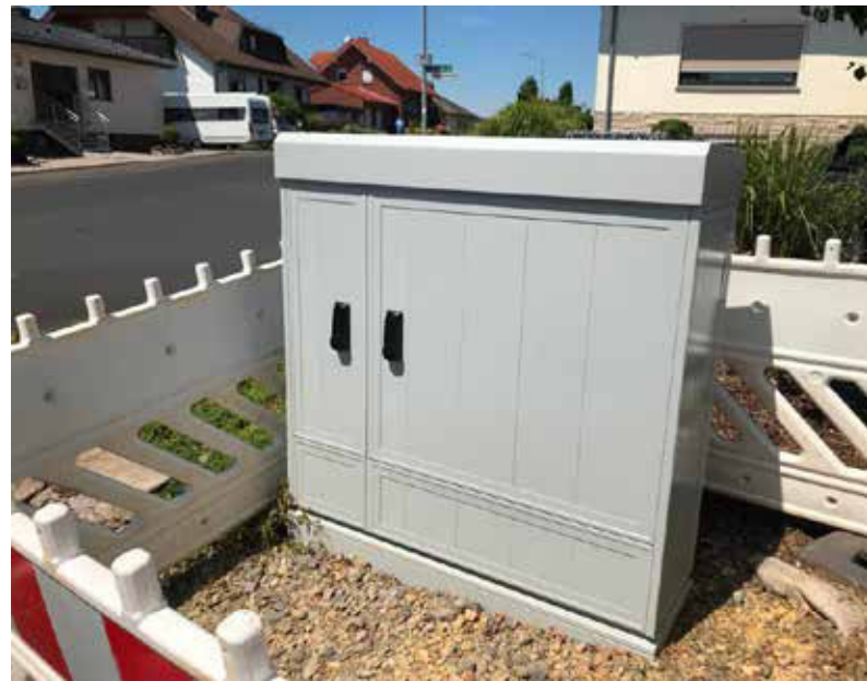
Über der Erde sind von Breitband nur Multifunktionsgehäuse sichtbar.