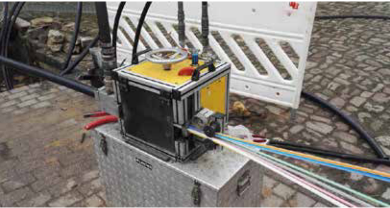
Diese Kabeleinzüge sorgen unter der Erde für eine flüssige Leitung.